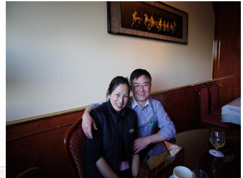
Aidi & Weigo

Viele Jahre war das „Mandarin“ unser Stammlokal. Hier haben wir uns immer sehr wohl gefühlt und wurden mit feinsten chinesischer Küche bestens verwöhnt. Wir trafen uns sehr gerne hier.