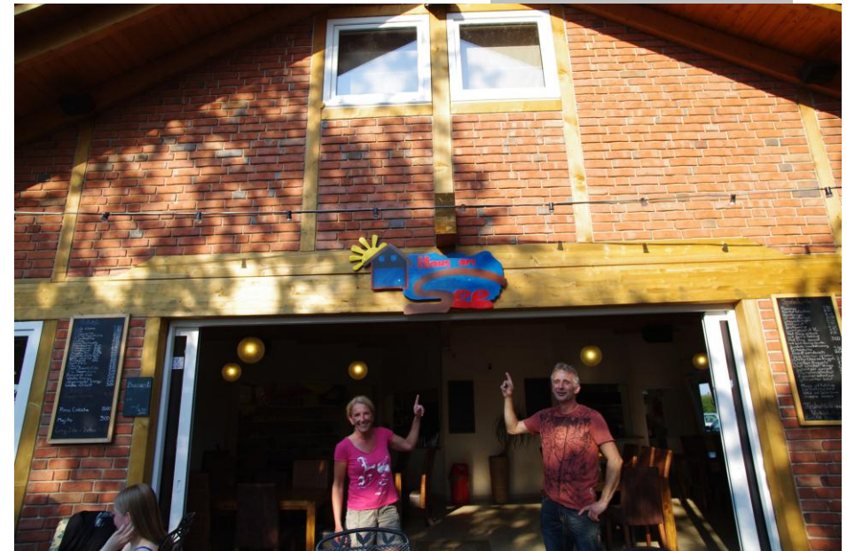
Das TEAM „vom Haus am See“ Heideseer See Holdorf